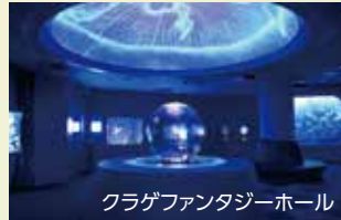
クラゲファンタジーホール