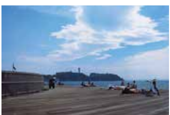
湘南海岸公園ミニ情報 開園面積：17.4ha 供用開始：1957年11月1日 湘南海岸公園は、相模湾に面し、江の島が目に見える景勝地です。この付近は、戦後日本を代表する海水浴場として発展し、「東洋のマイアミ」としてその名をせました。