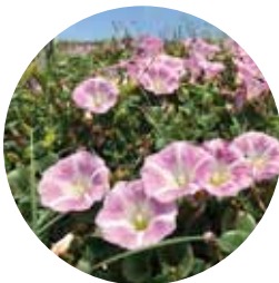
園内に咲くハマヒルガオ