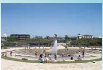
水の広場 噴水があり、夏には水遊びができます。また、イベントなども開催され、にぎわいます。