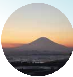
「関東の富士見100景」に選定されています