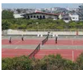
テニスコート(有料) 西部駐車場上にあり、明るいコートでテニスができます。 ・3～10月 9:00～17:00 ・11～2月 9:00～16:00 ※ラケット貸出、スクール有 【問合せ先】 西部駐車場 TEL.0466-35-0031