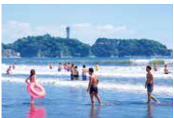
片瀬西浜・鵠沼海水浴場 夏は多くの海水浴客でにぎわいます。