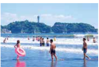
가타세니시하마·구게누마 해수욕장 여름에는 해수욕객들의 인파가 몰려듭니다.