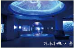
해파리 팬타지 홀