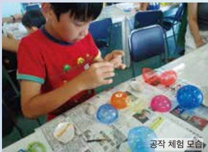
공작 체험 모습

■입장료/무료 ■개관 시간 / 3~11월 9:00~17:00 12~2월 10:00~17:00 ※시기에 따라 변경될 수 있습니다. 홈페이지 http://www.nagisataiken.com 〒251-0035 가나가와현 후지사와시 가타세카이간2-19-1 TEL.0466-28-6411