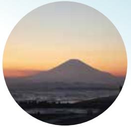
"간토 후지미 100경"으로 선정되었습니다.

평화의 상 난바 마고지로 제작(1965년). 비참한 전쟁의 불행을 다시는 반복하지 않도록 소원을 담아 설치되었습니다.