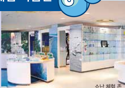
쇼난 체험 존

체험형 전시와 함께 자유참여형 공작 등 다양한 체험 학습 프로그램을 준비하고 있습니다.