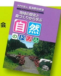
「地球の歴史と森づくりから学ぶ 自然のドリル」