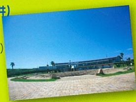
第10回 湘南海岸公園まつり・会場

協力: (株)湘南なぎさパーク/ (一社)海の学校/水・空・人/海の学校プロジェクト(保険加入協力)